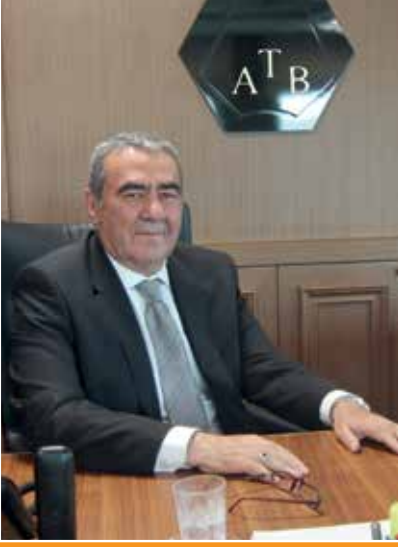
İbrahim Öztürk Meclis Başkanı