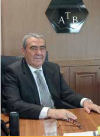
İbrahim Öztürk Meclis Başkanı