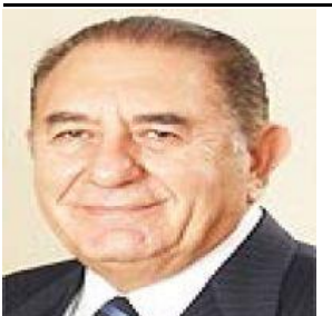
14 Ekim 2020

Anayasamızın 66. Maddesi, " Türk Devletine vatandaşlık bağı ile bağlı olan herkes Türktür. " diyor. Deniz Baykal, Türklüğün bir üst kimlik olduğuna sık-sık vurgu yapardı.