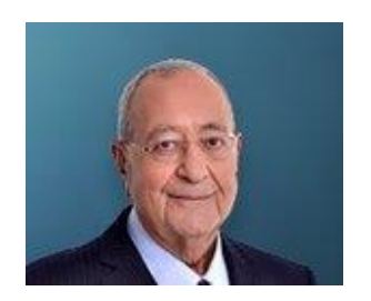
14 Ekim 2020, Çarşamba