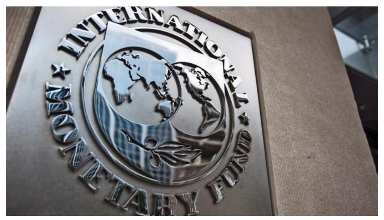
IMF, "Uzun ve zor bir tırmanış" başlığı ile yayımladığı Ekim 2020 Dünya Ekonomik Görünüm Raporu'nda, küresel ekonominin nisan ayındaki "büyük karantina" sırasına yaşadığı düşüşün derinliklerinden tırmanışa geçtiğine işaret edildi.

Uluslararası Para Fonu (IMF), küresel ekonomideki daralmanın özellikle gelişmiş ekonomilerde tahminlerden iyi gelen ikinci çeyrek gayrisafi yurt içi hasıla (GSYH) verilerinin etkisiyle öngörülenden daha az olacağını belirterek, dünya ekonomisinin bu yıl yüzde 4,4 küçülmesinin beklendiğini duyurdu.