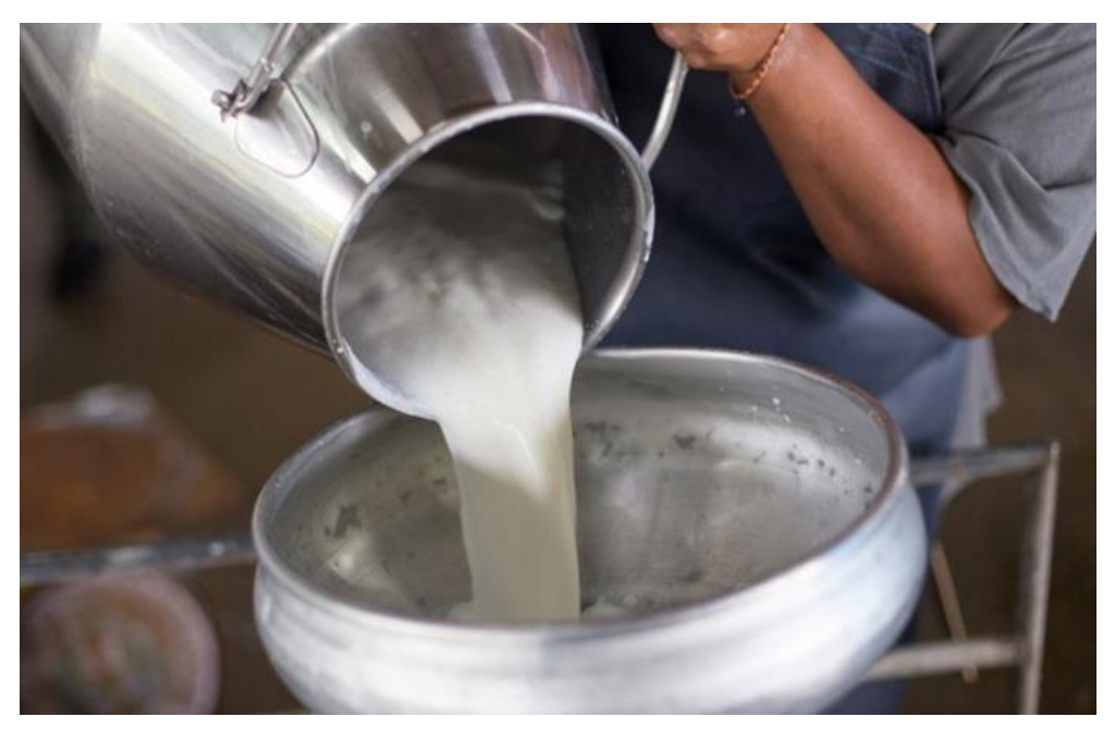
CHP Genel Başkan Yardımcısı Ahmet Akın, çiğ sütün referans fiyatının en az 3 lira olması gerektiğini bildirdi.

CHP Genel Başkan Yardımcısı Akın, çiğ sütün referans fiyatının en az 3 lira olması gerektiğini söyledi.