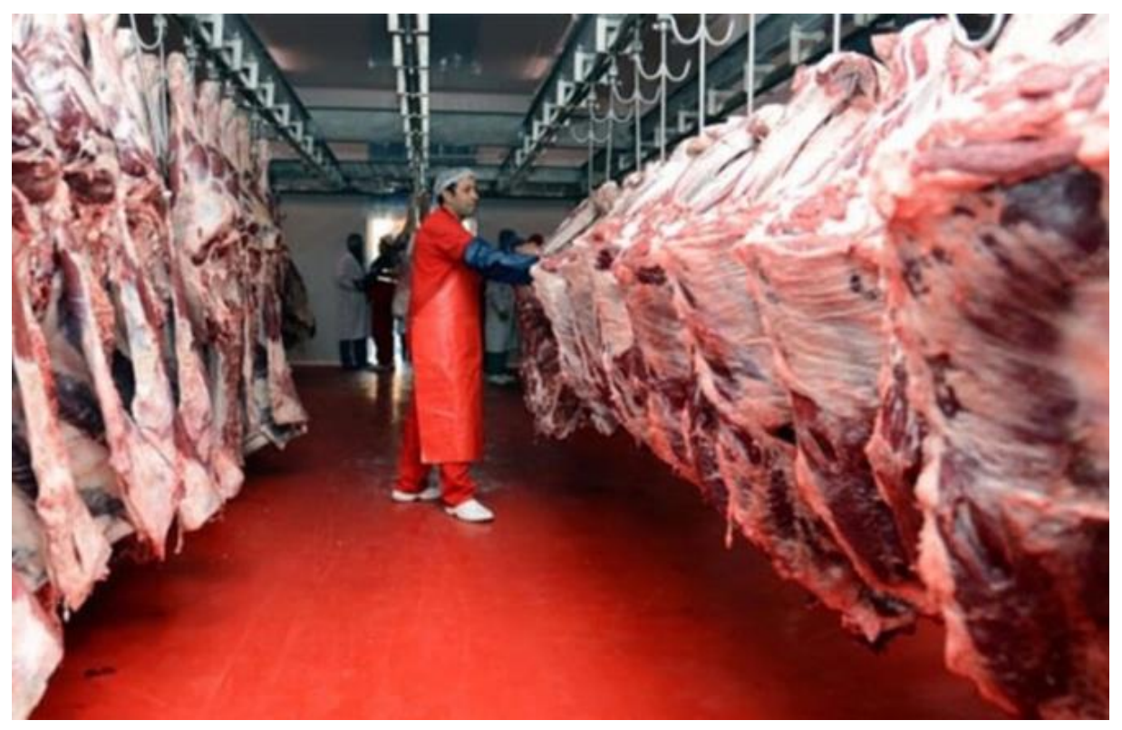
Bu kapsamda, söz konusu fiyat yarından itibaren geçerli olmak üzere ithal hayvanda 31 liradan 33 liraya, yerli hayvanda 32 liradan 34 liraya çıkarıldı.

Et ve Süt Kurumu (ESK), büyükbaş karkas et alım fiyatlarında kilogram başına 2 liralık artışa gitti.