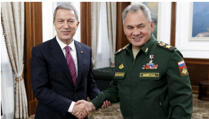
Bakan Akar ve Rusya Savunma Bakanı Sergey Şoygu

Cumhurbaşkanı Recep Tayyip Erdoğan'ın çözüme yönelik diplomatik çalışmaları sürerken, Milli Savunma Bakanlığı da harekete geçti.