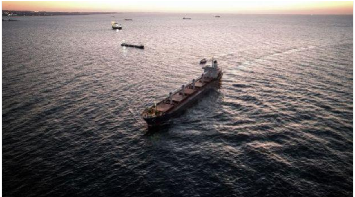
BM'nin İstanbul'daki tahıl koordinasyon merkezinin açıkladığı verilere göre, Türkiye, Ukrayna'nın tahıl ve gıda maddeleri ihracatında yüzde 26 ile ilk sırada yer aldı.

Küresel gıda krizinin ve artan gıda fiyatlarının çözümüne yönelik Türkiye'nin ve Birleşmiş Milletler'in (BM) arabuluculuğunda yapılan anlaşmanın ardından Ukrayna'dan ihraç edilen tahıl ve diğer gıda maddelerinin yüzde 26'sı Türkiye'ye geldi.