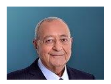
17 Ağustos 2022, Çarşamba BAŞYAZIMEHMET BARLAS