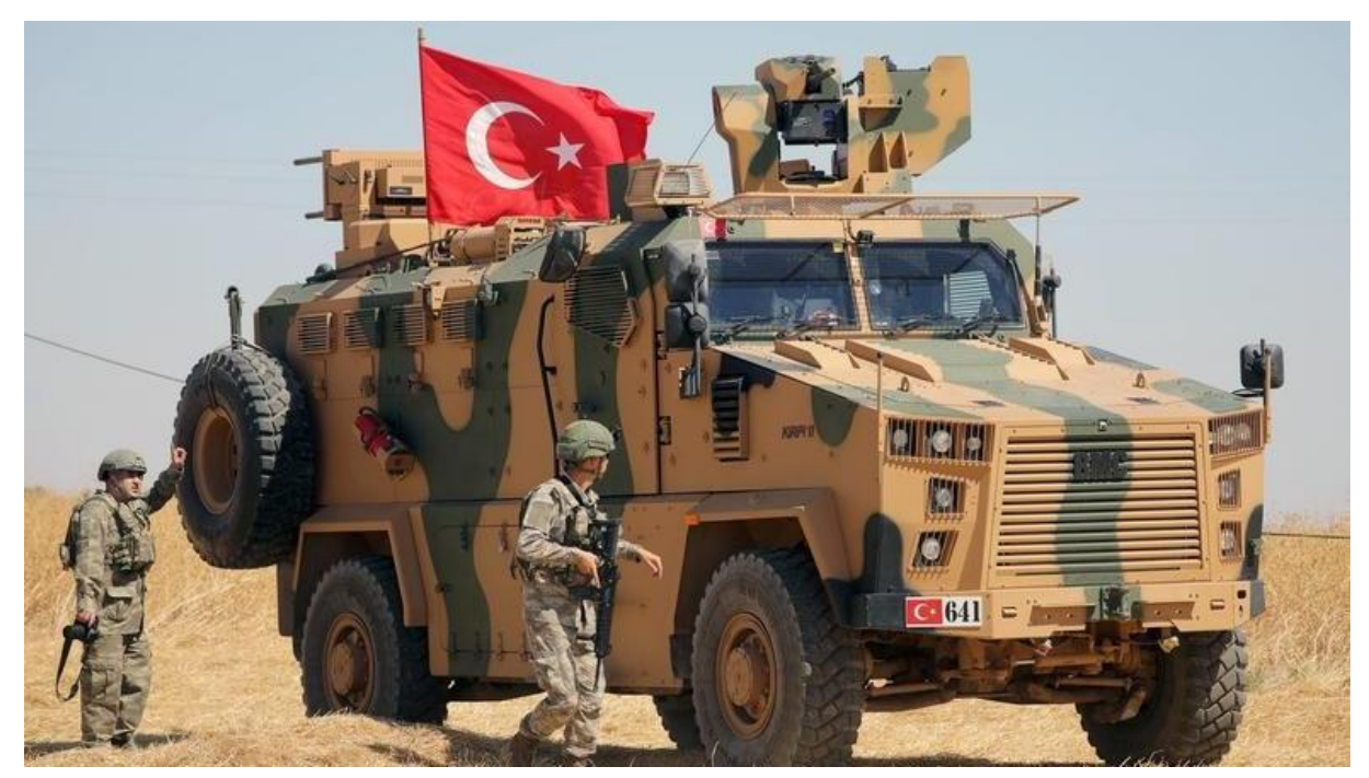
Türkiye'nin Suriye'nin kuzeyine askeri operasyon düzenleme planları uluslararası kamuoyunda gündemden düşmezken, Suriye medyası konuyla ilgili dikkat çeken bir haber yayınladı.

Türkiye'nin olası Suriye operasyonu bölgede askeri hareketliliği artırırken, Suriye medyasından çarpıcı bir iddia geldi.