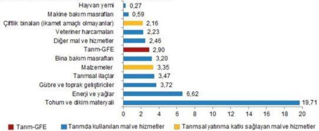
Alt gruplara göre Tarım-GFE aylık değişim oranı (%), Eylül 2022

Yıllık Tarım-GFE'ye göre 7 alt grup daha düşük, 4 alt grup daha yüksek değişim gösterdi.