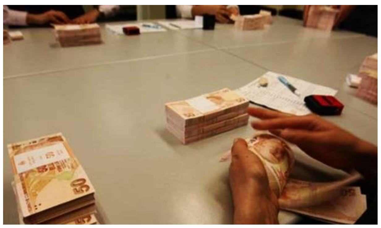
COVID-19 sebebiyle yaşanan ekonomik durgunluğun etkilerini hafifletmek amacıyla ertelenen yükümlülüklerin ödeme takvimi yaklaştıkça, iş dünyasında bunların yapılandırılması yönündeki talep de giderek yükseliyor.

Bazı yükümlülüklerde ertelemenin bittiği ve cari dönem vergilerinin çakıştığı ekim ayına günler kala, iş dünyası gözünü Meclis'e çevirdi.