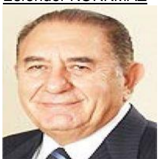
24 Eylül 2020

Dünkü gazetelerde, mezuniyet notu ve Ales'i diğer adaylardan düşük olmasına rağmen ilahiyat mezunu oğlunu doktoraya alan dekan, eksik eğitimine karşı on bin dolar bağış yapana diploma veren üniversite, 379 bin liralık makam aracı alan rektör gibi haberler vardı. Aslında bu tür olaylar her devirde vardı ve fakat rektörleri Cumhurbaşkanı doğrudan doğruya atamaya başladıktan sonra tırmandı.