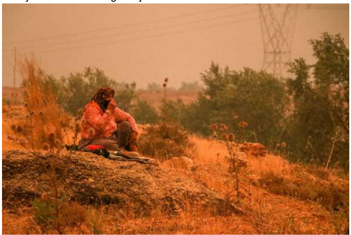
Dün öğle saatlerinde Manavgat'ın Yeniköy mahallesinde başlayan ve büyüyerek 4 farklı noktada gün boyu ilerleyen yangına müdahale devam ediyor.

Antalya'nın Manavgat ilçesinde dün başlayan yangına müdahale sürüyor. Manavgat merkeze 30 kilometre uzaklıkta başlayan yangın, gece boyunca hızla ilerledi. İlçe merkezine 4 kilometre uzaklıktaki Ulukapı Sülek Mahallesi de boşaltıldı. Tarım ve Orman Bakanı Bekir Pakdemirli, Akseki'de bir vatandaşın hayatını kaybettiğini ve Oymapınar Barajı'nda 10 kişinin mahsur kaldığını açıkladı.