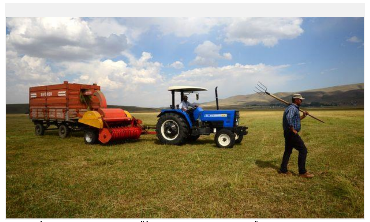
Türkiye İstatistik Kurumu'nun (TÜİK) bu yıla ilişkin "Bitkisel Üretim 2. Tahmini" veri ışığında bitkisel üretimde geçen yıla göre artış gerçekleşti.

TÜİK tarafından yılın ikinci bitkisel üretim tahminleri açıklandı