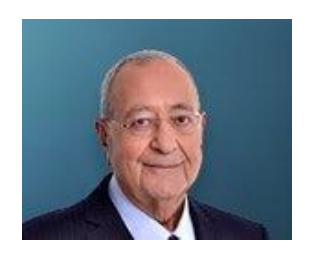
29 Aralık 2020, Salı